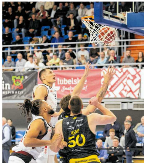
• W tym sezonie koszykarze Polskiego Cukru Startu są we własnej hali niepokonani

Zespół z Dolnego Śląska trzy ostatnie sezony miał udane. Najpierw wyalczył medal mistrzostw kraju, potem stanął na najwyższym stopniu podium, a minione rozgrywki zakończył na drugiej pozycji. Początek tego sezonu nie przebiega jednak zgodnie z oczekiwaniami wrocławskiego klubu. W pięciu do tej pory rozegranych spotkaniach Orlen Basket Ligi drużyna trenera Oliviera Vidina odniosła dwa zwycięstwa – oba u siebie i poniosła pięć porażek. Najpierw Śląsk pokonał Tauron GTK Gliwice 80:75, a potem gdyńską Arkę (88:79). Co zaś się tyczy przegranych, to wrocławianie nie sprościli przed własną publicznością Kingowi Szczecin (60:83), natomiast na parkietach rywali ulegli MKS-owi Dąbrowa Górnicza 80:82, a w ostatniej kolejce wrocławianie przegrali we Wrocławiu z Anwilkiem 74:80. W tym spotkaniu najsukcesywniejszymi zawodnikami w zespole wicemistrza Polski byli Dusan Miletic, który rzucił 15 punktów, oraz Saulis Kulivietis, który zdobył o jedno oczko mniej. Ostatnio niczym grom z jasnego nieba gruchnęła wiadomość, że rozgrywający wrocławian Franke Ferrari, który podpisał kontrakt dopiero 15 października, postanowił... zakończyć karierę. Ten 27-letni Amerykanin, z występami w klubach