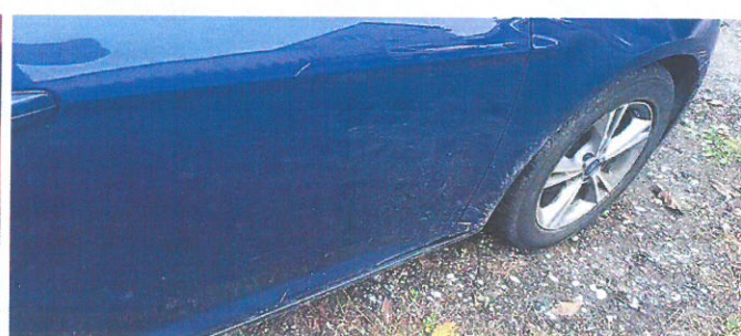
FORD Focus 16