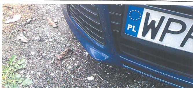
FORD Focus 10