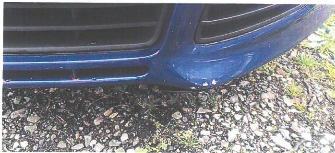
FORD Focus 11