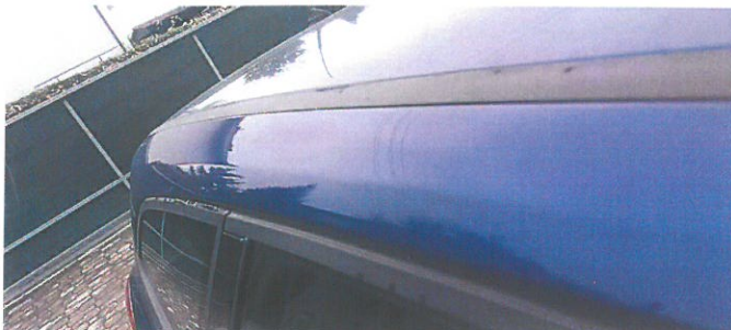
FORD Focus 23