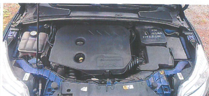
FORD Focus 12