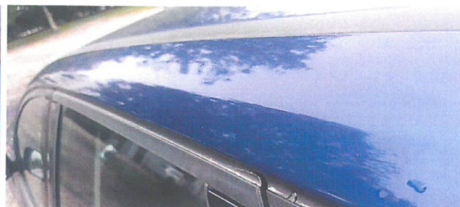
FORD Focus 24

POLSKI ZWIĄZEK MOTOROWY OKRĘGOWY ZESPÓŁ DZIAŁALNOŚCI GOSPODARCZEJ Sp. z o.o. BIURO CERTYFIKOWANYCH RZECZOZNAWCÓW SAMOCHODOWYCH tel. (81) 5334201, 5334207, fax: 81 5334300 20-064 Lublin, ul. B. Prusa 8