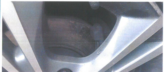
FORD Focus 22