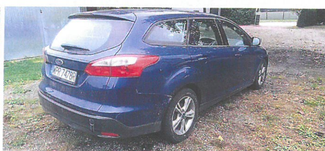
FORD Focus 6