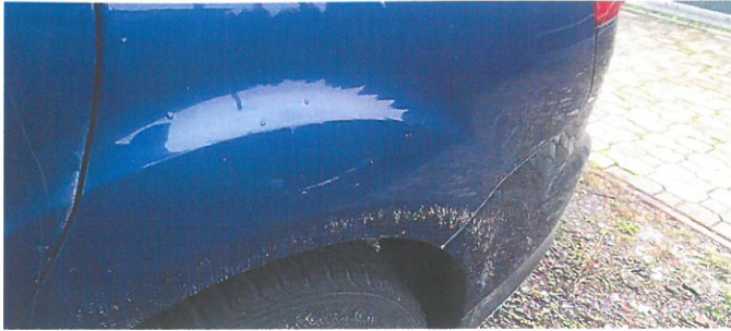
FORD Focus 19