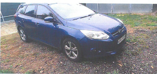
FORD Focus 4