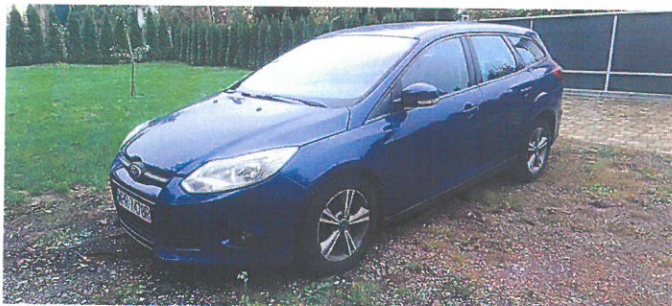
FORD Focus 3