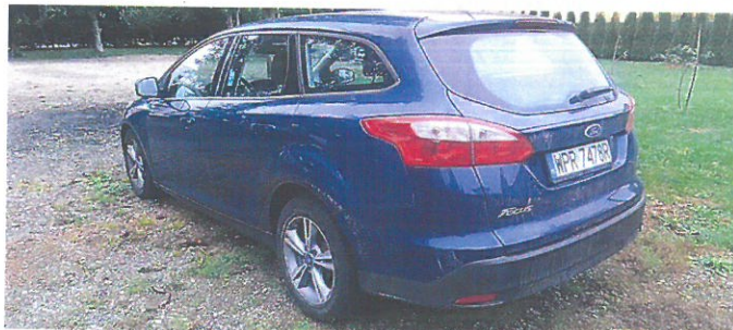
FORD Focus 7