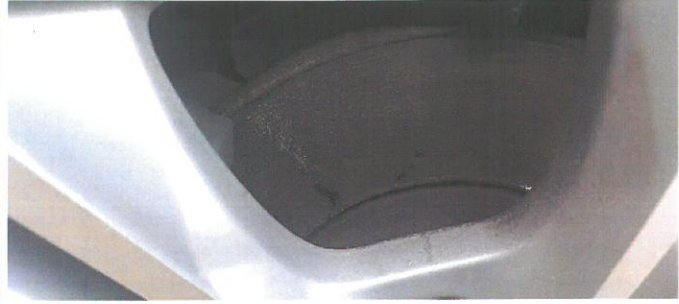
FORD Focus 20