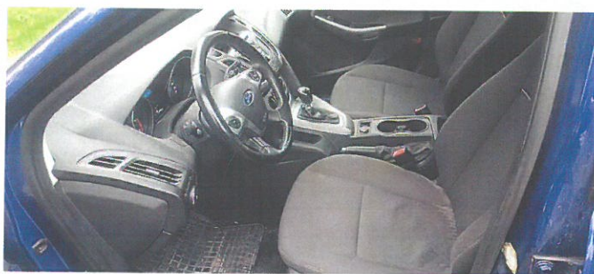
FORD Focus 2