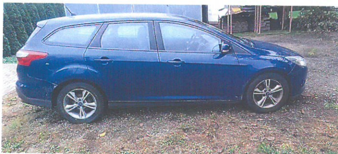
FORD Focus 5