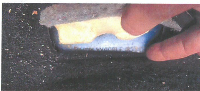
FORD Focus 15