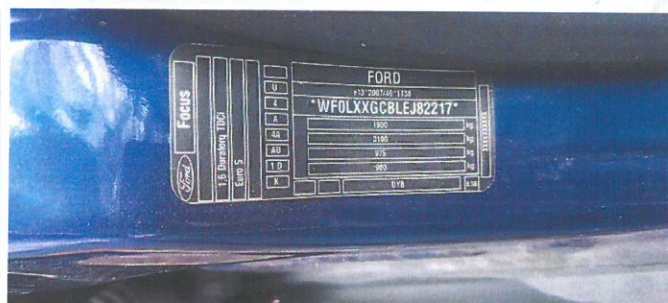
FORD Focus 14