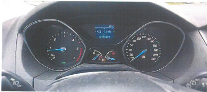
FORD Focus 1