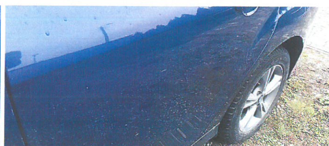
FORD Focus 18