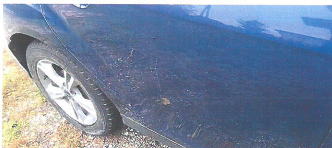
FORD Focus 17