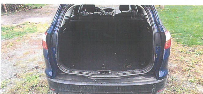
FORD Focus 8