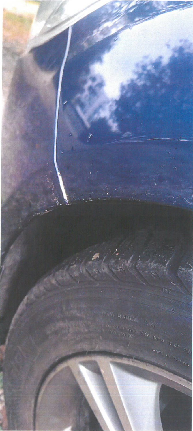
FORD Focus 21