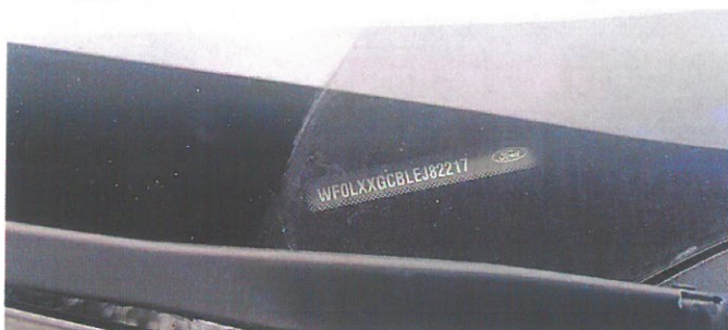
FORD Focus 13